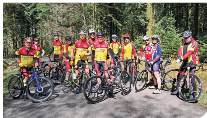
Les cyclos du club au col de la Source