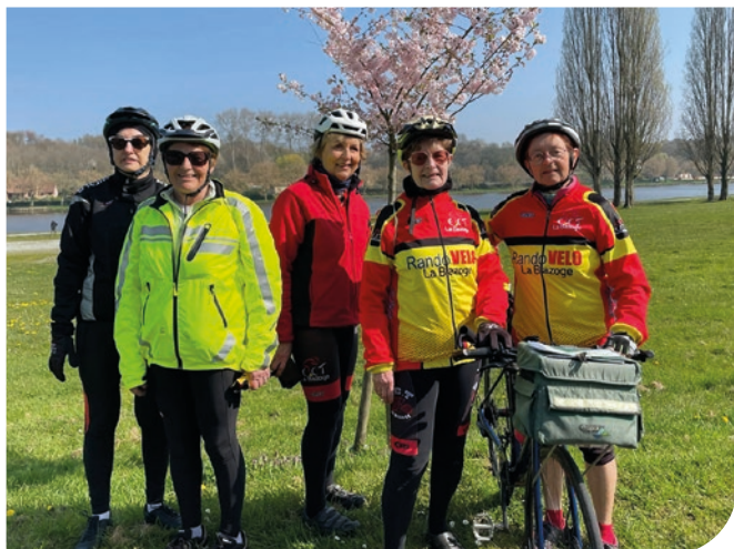
Sortie du CODEP 72 des féminines

Dimanche matin : RDV VTT 9h au parking du gymnase.