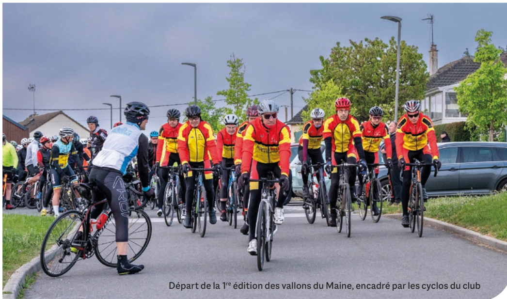
Départ de la 1 re édition des vallons du Maine, encadré par les cyclos du club

Tous les participants étaient très satisfaits des parcours proposés, du ravitaillement et de l'accueil chaleureux de nos membres.